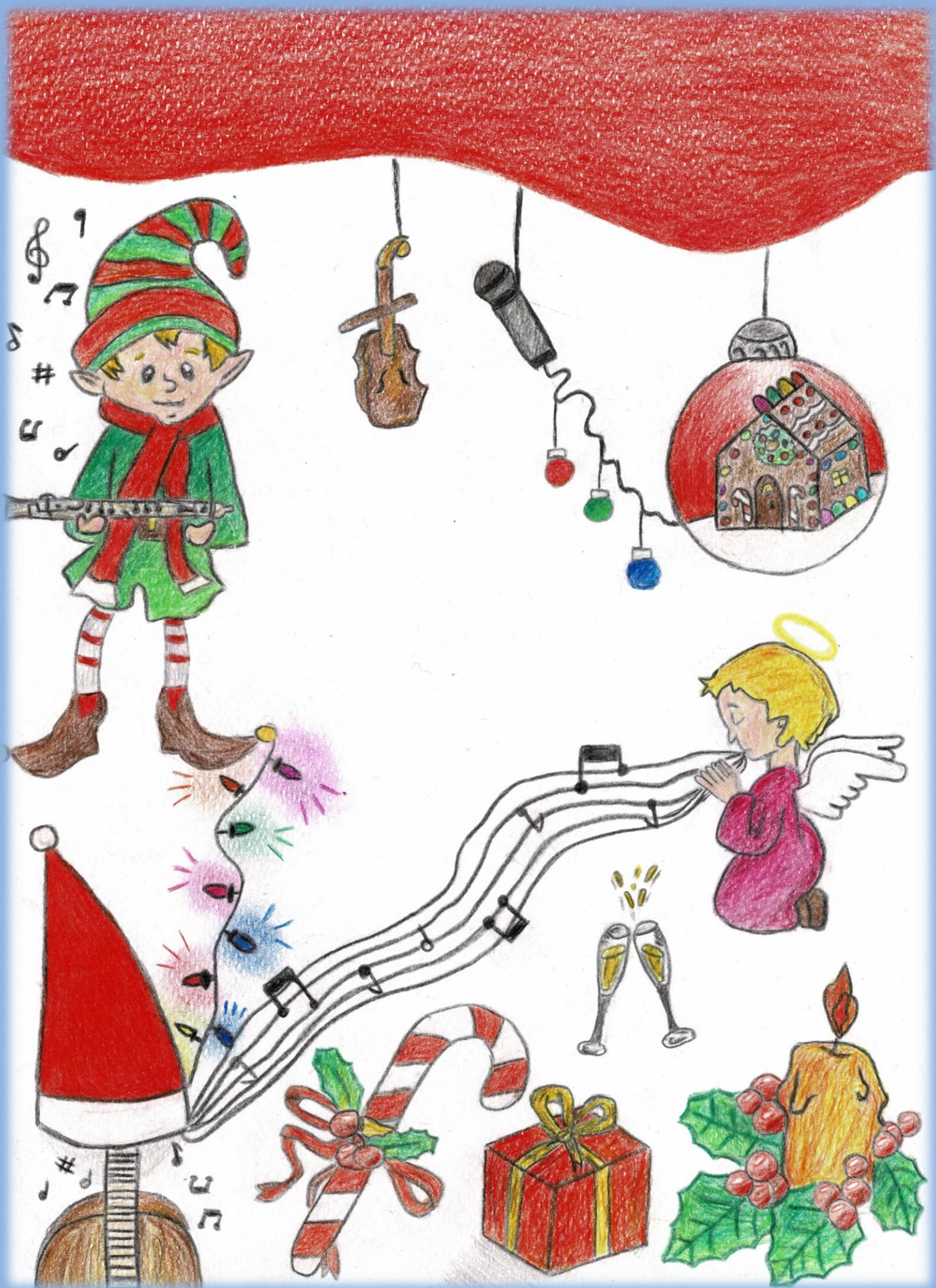
disegno di Martina Adamo 3G